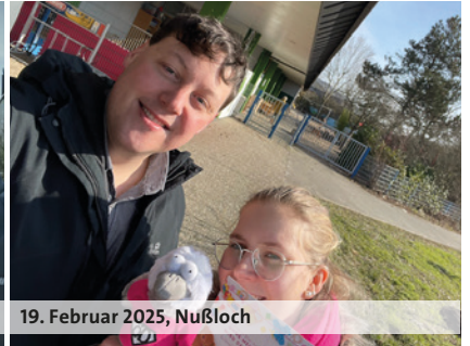
19. Februar 2025, Nußloch