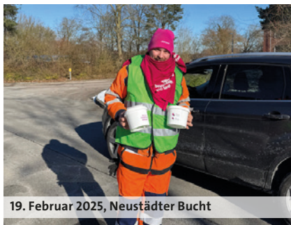
19. Februar 2025, Neustädter Bucht