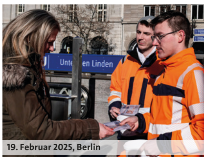
19. Februar 2025, Berlin