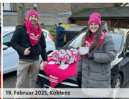
19. Februar 2025, Koblenz