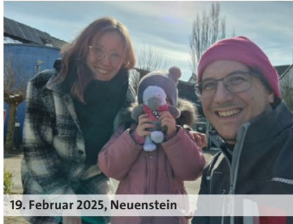
19. Februar 2025, Neuenstein