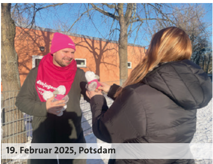
19. Februar 2025, Potsdam