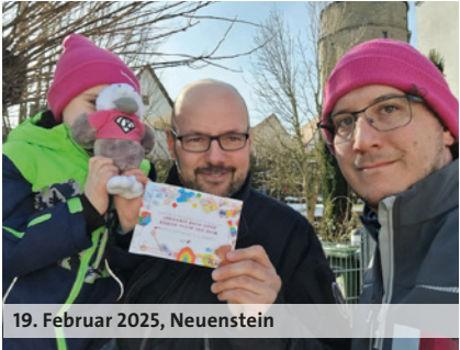
19. Februar 2025, Neuenstein