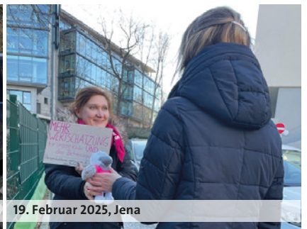
19. Februar 2025, Jena